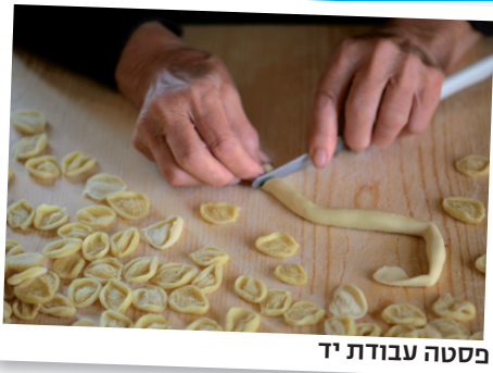
פסטה עבודת יד

שהגעתי לאיזה שהוא חור. לא ציפיתי להרכיב מבארי, וכצפוי במקרים כאלו, היא הפתיעה בגדול. ההליכה בסבך סמטאות העיר העתיקה Bari Vecchia ובמיוחד ברחוב בו יושבות נשים וחותכות את הפסטה המקומית Orecchiette, הבתים הפתוחים אל הרחוב, הווספות והכבי- סה המתנפנת מן המרפסות... לא ברור לי אם אני נמצאת בעיר אמיתית או אולי על איזה סט של סרט שהבמאי שלו חיפש לוקיישן של עיר איטלקית אמיתית: העיירות האוטנטיות של 'הדרום החדש' מצטלמות טוב, ובארי בהחלט יכולה להיות הבירה שלהן. בשנה הבאה או בהו- דמנות הקרובה: צפון פוליה עם שמורת גרגאנו, מונטה סנט אנג'לו וסן ג'ובני רוטונדו.