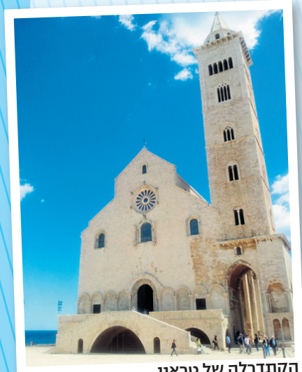
הקתדרלה של טראני

אחת מעיירות החוף היפות ביותר בפוליה היא טראני Trani הנמצאת