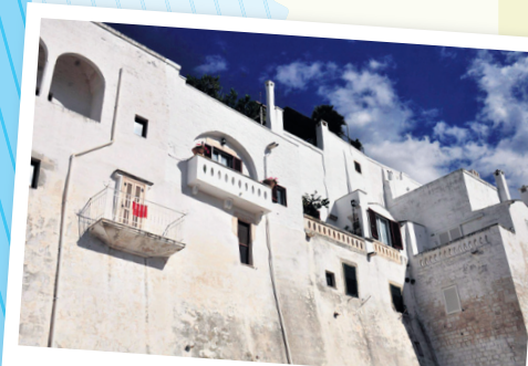
אוסטוני העיר הלבנה

● מה מביאים הביתה? אל תחמיצו ביקור בחנות מעדנים מקסימה הממוקמת בתוך טרולי. כאן תוכלו לטעום ולרכוש כוש מעדנים מקומיים כמו פסטת אורי-קייטה Orecchiette (פסטה עגולה בצורת אוזניים), סלמי capocollo, גבינות