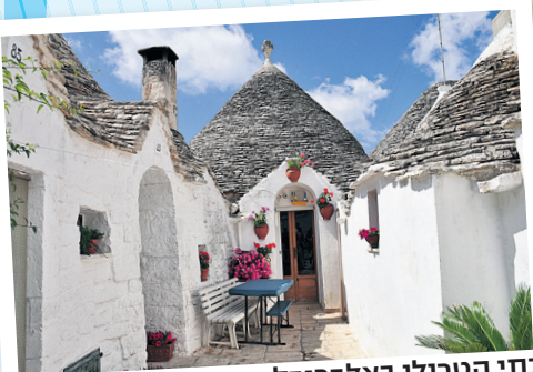
בתי הטרולי באלברובלו

אלברובלו נבנתה על שתי גבעות והיא מחולקת לשני אזורים עיקריים: אזור המגורים (Aia Piccola) ואזור המסחר (Rione Monti). מרכז העיירה נמצא בעמק שבין שני אזורים אלו, ונקרא לארגו מרטלוטה Largo