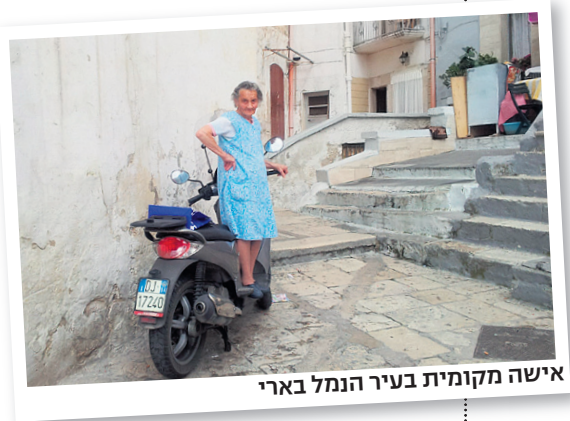
אישה מקומית בעיר הנמל בארי

הקטן הצמוד אליו נותן למבקר הזרמנות ראי- שונה לפגוש את הגיבורים הראשיים שיככבו בארוחת הצהריים שלו. מהנמל עולים אל קתדר- רלה רומנסקית מיוחדת במינה: גבוהה, מבודדת